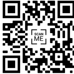
แบบสมัครขอรับทุน

คณาจารย์ และนักศึกษาของมหาวิทยาลัยเทคโนโลยีพระจอมเกล้าพระนครเหนือ ที่ประสงค์ขอรับทุนสนับสนุนการศึกษาวิจัยดังกล่าว สามารถสมัครขอรับทุนได้โดยยื่นแบบสมัครและเอกสารต่างๆ ที่จัดเตรียมตามแบบฟอร์ม/รูปแบบ และเงื่อนไขที่กำหนด ส่งมายังฝ่ายบริหารงานวิจัย สำนักวิจัยวิทยาศาสตร์และเทคโนโลยี ตามระยะเวลาที่กำหนด ดังเอกสารแนบท้าย โดยสามารถดาวน์โหลดแบบสมัครขอรับทุนและเอกสารต่างๆ ได้ที่ http://bit.ly/301w77a หรือคิวอาร์โค้ดด้านล่าง หรือ เว็บไซต์ของสำนักวิจัยวิทยาศาสตร์และเทคโนโลยี ( http://stri.kmutnb.ac.th/ )